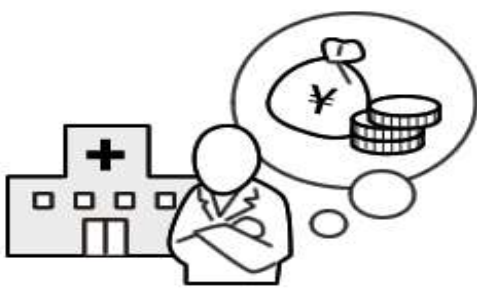
医療費に関わる消費税制の見直し