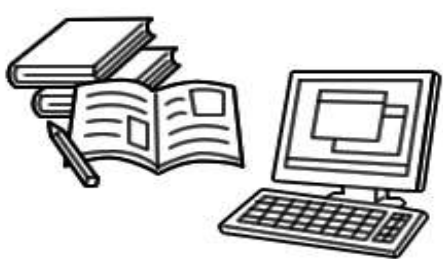
公的職業訓練の見直し