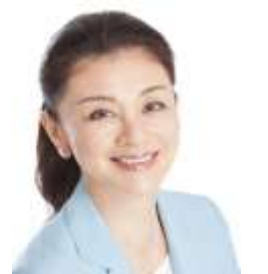
参議院議員・女優 みつこ 石井苗子