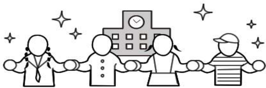
教育機会平等社会