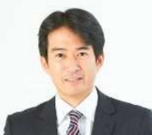
東京都議会議員 やながせ裕文