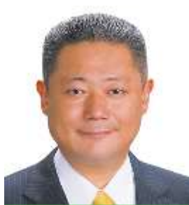
党幹事長 馬場伸幸